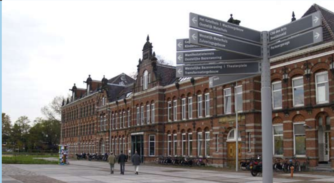
Westergasfabriekterrein, creatieve broedplaats, Amsterdam