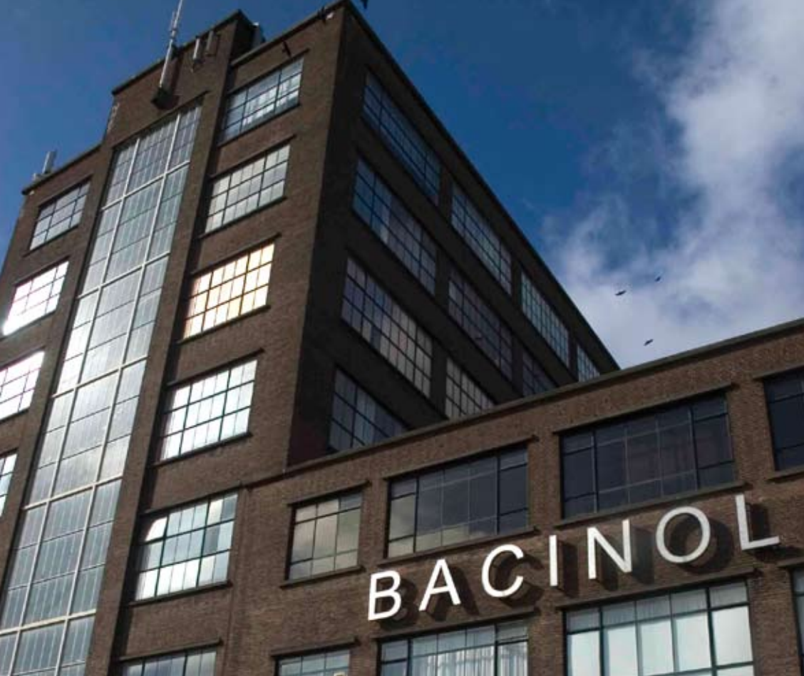
Bacinol - creatieve werklocatie te Delft